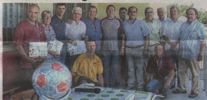
Les récipiendaires des distinctions de la LAFA lors du 95 e anniversaire de l'AS Osthouse.