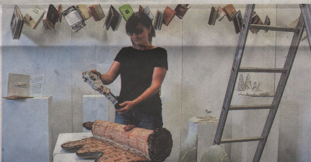
Des bénévoles à Obernai et deux ouvriers municipaux à Gerstheim ont aidé les artistes à installer leurs œuvres.

La 7 e Biennale internationale de mosaïque contemporaine démarre aujourd'hui à Obernai et, pour la première fois, à Gerstheim. À la cour Athic, les œuvres de Felice Nittolo et BiblioMosaico , une recherche autour du livre réalisée par des artistes de diverses nationalités. À l'église Saint-Denis, le travail d'Enzo Tinarelli.