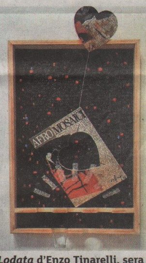
Lodata d'Enzo Tinarelli, sera exposée à l'église Saint-Denis de Gerstheim.